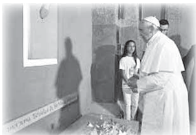
Papa Francesco in preghiera alla tomba di Mazzolari.

a parlare di Francesco d'Assisi e il lupo , titolo anche del recente (2016) libretto nel quale le Edizioni Messaggero Padova hanno ripubblicato il testo.