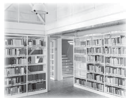
Scorcio su una sala della biblioteca distribuita su tre piani e due ammezzati, aperta a tutti i cittadini. Sotto: Il rettore magnifico (a destra) e altre autorità.