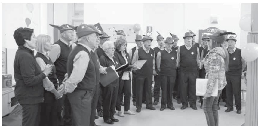
L'alzabandiera: il coro degli alpini apre la festa.