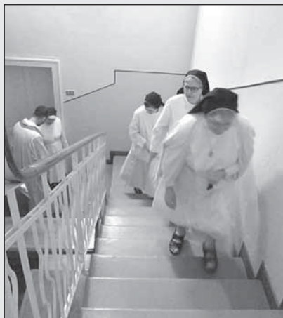
Verso l'appartamento, per la benedizione.

venne ricostruito e ampliato con due saloni mensa. Le Cucine divennero così anche spazio dove poter sostare e consumare il pranzo e la cena, e per molti anni saranno la mensa "economica" per gli operai che venivano a lavorare in città e per i giovani che affluivano nel capoluogo a studiare.