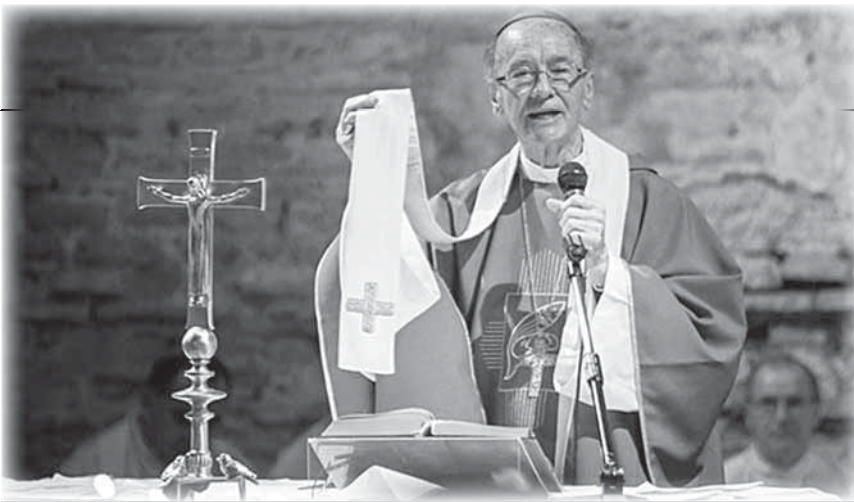
Il cardinale Claudio Hummes, francescano brasiliano, relatore generale del sinodo, nell'incontro alle catacombe esibisce la "reliquia" della stola di Helder Camara.

che passi per la formazione di una Chiesa ministeriale, che faccia crescere vocazioni autoctone, che stabilisca anche nuove ministerialità, come quelle che possono riguardare la donna. Suggestisce di ripensare il ruolo dei laici, della vita consacrata, superando il clericalismo e i meccanismi di potere che ancora esistono un po' dappertutto.