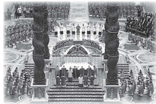
6 ottobre 2019, celebrazione eucaristica di apertura del sinodo.

A questo riguardo disse: «C'è un punto sul quale vorrei sof- fermarmi, e che ritengo rilevante per il cammino attuale e futuro non solo della Chiesa in Brasile, ma anche dell'intera compagine sociale: l'Amazzonia... Vorrei in- vitare tutti a riflettere su quello che Aparecida ha detto sull'Amaz- zonìa, anche il forte richiamo al rispetto e alla custodia dell'intera creazione che Dio ha affidato all'uomo non perché lo sfrutti selvaggiamente, ma perché lo renda un giardino... Ma, vorrei aggiungere che va ulteriormen- te incentivata e rilanciata l'opera della Chiesa. Servono formatori qualificati, soprattutto formatori e professori di teologia, per con- solidare i risultati ottenuti nel campo della formazione di un clero autoctono, anche per avere sacerdoti adattati alle condizioni locali e consolidare, per così dire, il volto amazzonico della Chiesa. In questo, per favore, vi chiedo di es-