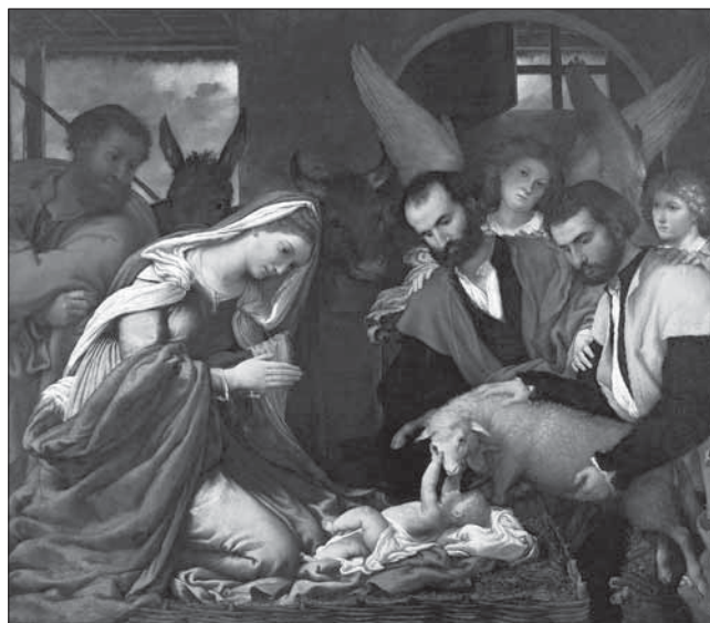
In copertina: LORENZO LOTTO, L'adorazione dei pastori , 1539, Pinacoteca Tosio Martinengo, Brescia.

(alle pagine 17-19 spiegazione e commento)