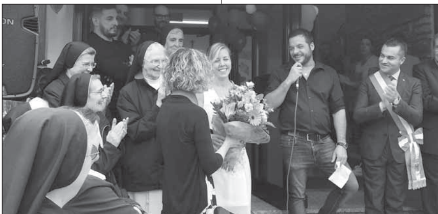
Omaggio floreale riconoscente al comitato.