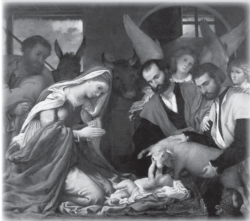
LORENZO LOTTO, L'Adorazione dei pastori , 1539, Pinacoteca Tosio Martinengo - Brescia.

La porta e la finestra di fondo costituiscono una felice intuizione di predisporre dei punti luce che