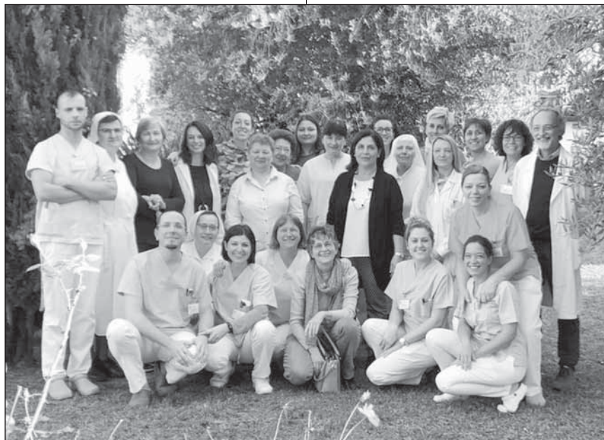
Operatori e suore, un bel gruppo di lavoro, a servizio di Casa Santa Chiara.