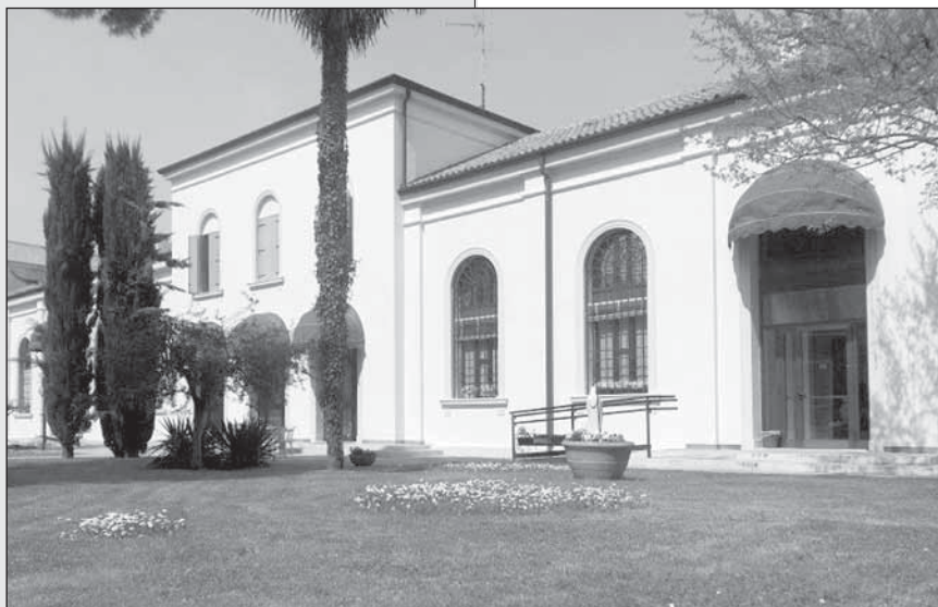
La casa dopo l'ultima ristrutturazione.

Hospice e Casa alloggio insieme chiedono però cambiamenti