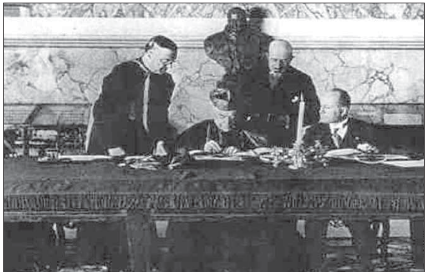
11 febbraio 1929, nel palazzo del Laterano, il card. Pietro Gasparri (a sinistra), segretario di Stato, e Benito Mussolini, presidente del Consiglio, firmano i Patti lateranensi.

L'11 febbraio 1929, poco prima di mezzogiorno, sotto una pioggia scrosciante, Benito Mussolini, capo