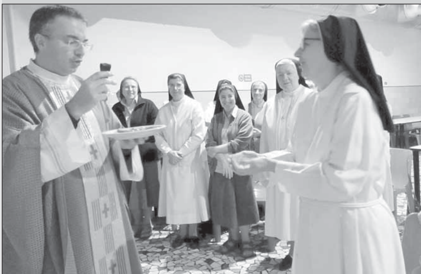
La consegna delle chiavi.

Nel 1946 l'edificio, distrutto dai bombardamenti della guerra,