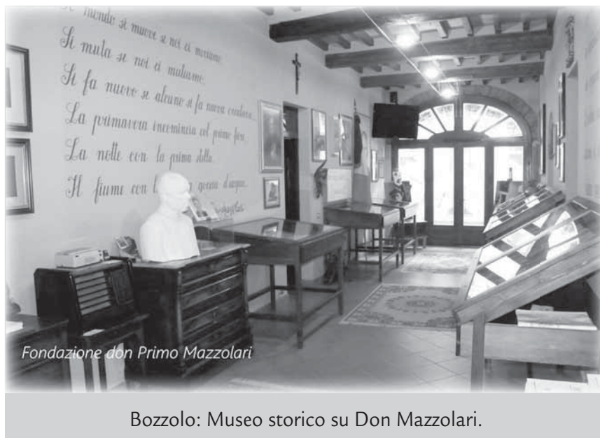
Bozzolo: Museo storico su Don Mazzolari.

duarne il segreto, a tratteggiarne la personalità e la storia, arricchendo negli anni la vasta letteratura mazzolariana di contributi che, se hanno il pregio di aiutare ad accostare don Primo, non possono tuttavia sostituirsi alla lettura diretta dei suoi scritti e discorsi, che davvero meriterebbero migliore fortuna anche nell'Italia d'oggi: Tu non uccidere, La più bella avventura, Il Samaritano, La Samaritana, Tempo di credere... solo per citarne alcuni.