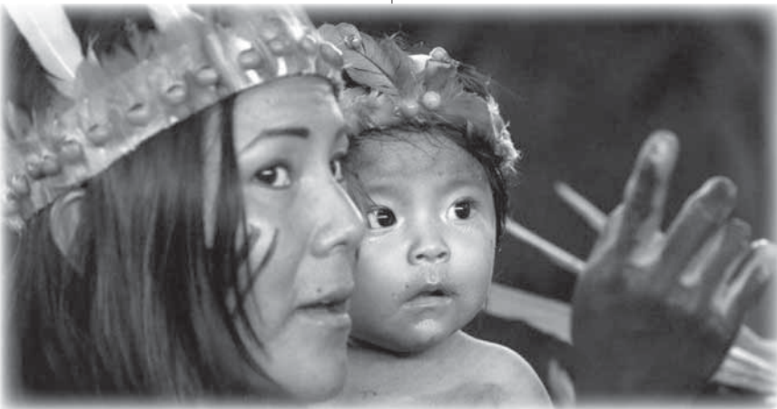
Madre e figlio indigeni.

L'Amazzonia, in Brasile, è anche uno stato con una capitale, Manaus. Una città di oltre due milioni di abitanti. Una città ricca, piena di vita, cosmopolita. Non a causa del turismo - pure importante - ma anche e soprattutto per la presenza di grandi compagnie di ogni parte del mondo: Nokia, Gradiente, Samsung, Sony... È zona franca: che significa esente da tasse di importazione ed esportazione e con altre agevolazioni per coloro che in Amazzonia vanno a "portare sviluppo". Sono molti, attratti dalla ricerca di materie prime, minerali, legno, pesca, agricoltura, dal mercato del bestiame, della soia, dall'oro. Fatturati annui di centinaia di miliardi di dollari.