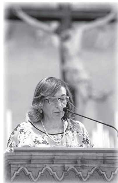
Proclamare la Parola: un ministero nella Chiesa.

Papa Francesco aveva già insistito molto su questo aspetto, ma