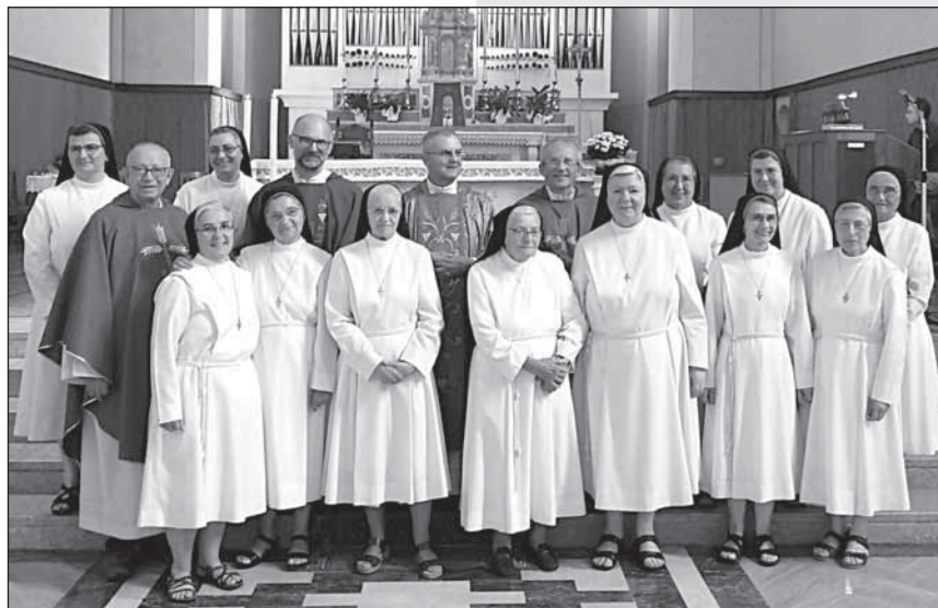
Foto di gruppo al termine della celebrazione.

Prima di concludere la celebrazione, varie voci hanno voluto esprimere alle suore parole di riconoscenza, di stima e di affetto: un rappresentante della comunità parrocchiale di Pianzano, un'insegnante della scuola dell'infanzia assieme ad alcuni bambini e il gruppo dei chierichetti che ha consegnato ad ognuna delle tre suore la sagoma di un albero con i