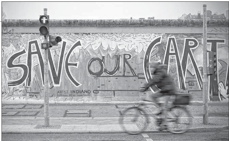
Nelle foto: immagini della "caduta" del muro e di alcuni graffiti.

Germania viene divisa in quattro zone. Queste vengono occupate da americani, sovietici, inglesi e francesi. L'obiettivo di questa spartizione è quello di impedire alla Germania di diventare una forza politica ed economica e di scatenare nuovamente un conflitto di proporzioni mondiali.