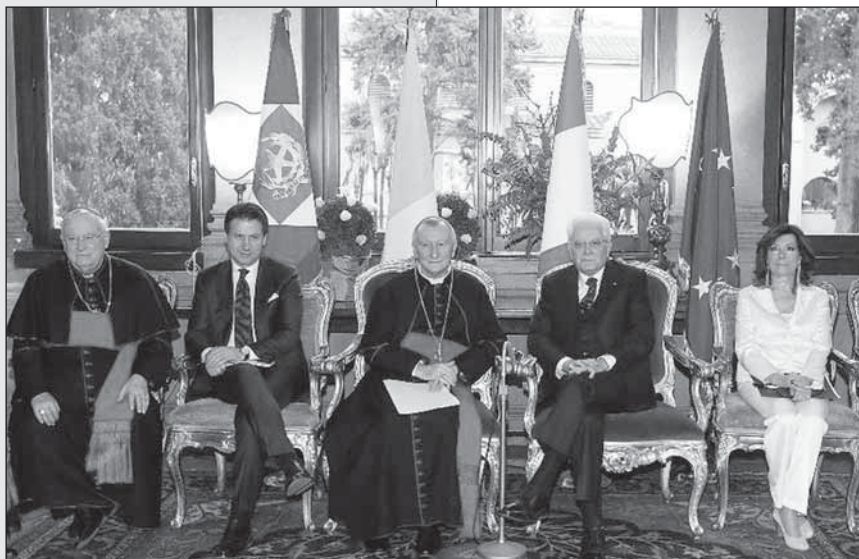
Incontro a palazzo Borromeo, sede dell'ambasciata italiana presso la Santa Sede a Roma, per ricordare i 90 anni dalla firma dei Patti Lateranensi. Da sinistra: card. Gualtiero Bassetti, presidente della CEI, Giuseppe Conte, presidente del Consiglio, card. Pietro Parolin, segretario di Stato, Sergio Mattarella, presidente della repubblica, Elisabetta Casellati, presidente del senato.

Si è così concluso il lungo procedimento, col quale Chiesa cattolica e Stato italiano hanno inteso e voluto regolare i loro rapporti, in uno spirito di collaborazione e di libertà, nel rispetto dell'indipendenza e sovranità dell'ordine proprio. ■