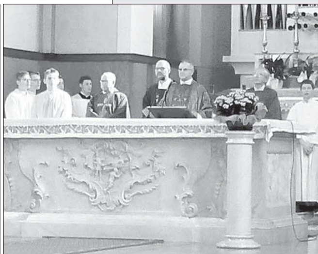
Durante la celebrazione eucaristica.