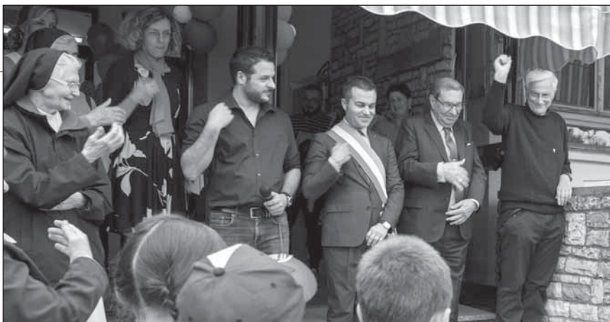
Il parroco benedice tutti i presenti.

glie benestanti locali hanno finanziato la costruzione di una scuola dell'infanzia, che permettesse un supporto alle famiglie che versavano in particolari situazioni di difficoltà per la situazione economica e sociale creatasi nel dopoguerra. Tale struttura offriva un ricovero sicuro per bambini di vedove o famiglie numerose, dove spesso il padre lavorava all'estero e garantiva un'educazione di stampo cattolico. Infatti la struttura era gestita dalla parrocchia con l'aiuto delle Suore Elisabettine che arrivavano da Padova» 1 .