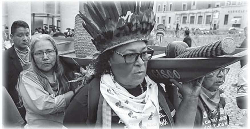
Momento celebrativo con doni caratteristici della cultura amazzonica.

da, la Chiesa amazzonica vuole essere la prima a cambiare: riconosce che deve essere più aperta al dialogo interculturale e inter-religioso; assume l'impegno della conversione ecologica, per la quale esistono proposte molto concrete; e acquisisce il coraggio e la fermezza per avvicinarsi alle vittime e alle persone minacciate.