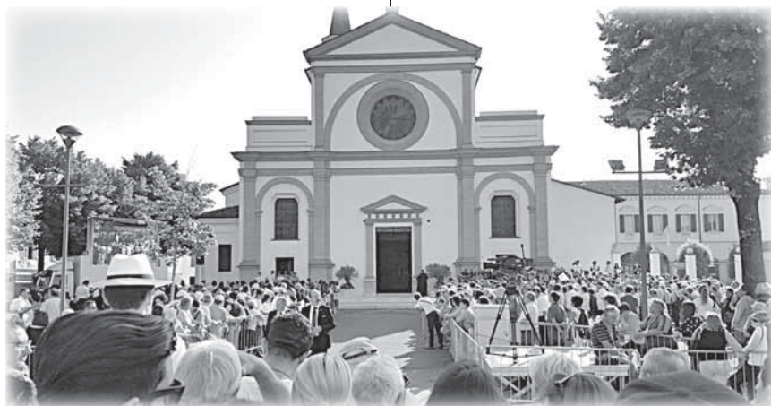
20 giugno 2017: la folla nel piazzale della chiesa di Bozzolo attende l'arrivo del Papa.