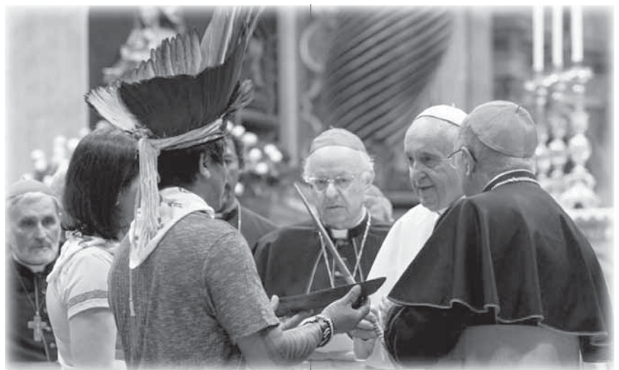
Incontri di indigeni dell'Amazzonia con il Papa durante il sinodo.

Sento che questo sinodo offre un enorme contributo al mare della Chiesa cattolica, che si arricchisce con i colori e i sapori della vita dell'Amazzonia; proprio come il Rio delle Amazzoni raccoglie acqua da molti affluenti, questo sinodo ha favorito anche l'incontro di molte