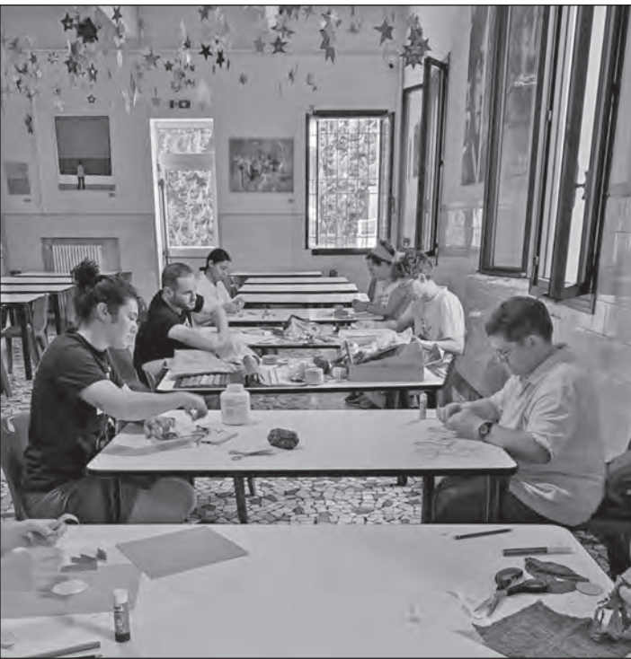
Laboratorio sul nome. Nella pagina accanto: il servizio nella distribuzione dei pasti.

operano o sono in qualche modo coinvolte.