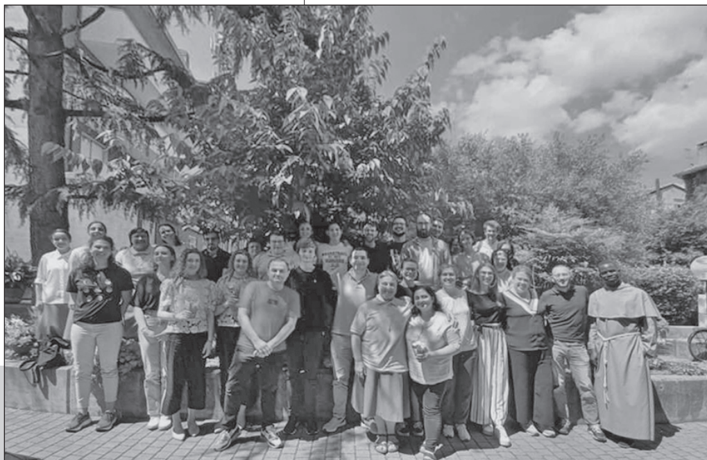
Foto di gruppo prima del saluto.

di solidarietà del territorio di Padova e provincia; questo gruppo nasce proprio per dare la possibilità ai giovani di imparare ad aprirsi alla povertà che li circonda. È un'enorme occasione di arricchimento personale che permette di immergersi in realtà differenti ma molto intense, e di poter vivere un'esperienza che nella vita di tutti i giorni non si potrebbe fare. "ServiAmo" è un gruppo che dà proprio la possibilità di conoscere persone diverse e aiuta ad entrare in contatto con culture differenti dalla nostra. Riesce a cambiare completamente il valore che si dà alle cose e alla propria vita. La cosa che più mi è piaciuta di quest'esperienza è che ti "apre gli occhi" e ti mette di fronte alle persone che soffrono o che hanno sofferto in passato, che sono in grado di condividere la loro storia grazie alle