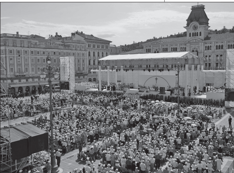
Celebrazione eucaristica conclusiva della settimana sociale presieduta da papa Francesco in piazza Unità a Trieste.

Il Presidente si è chiesto se vi sia, e quale sia, un'anima della democrazia. E cos'è che faccia della democrazia "l'ossatura che sorregge il corpo delle nostre istituzioni e la vita civile della nostra comunità". Egli ha chiarito che "la democrazia non si esaurisce nelle sue norme di funzionamento", ferma restando l'imprescindibilità della definizione e del rispetto delle "regole del gioco". Ha quindi indicato