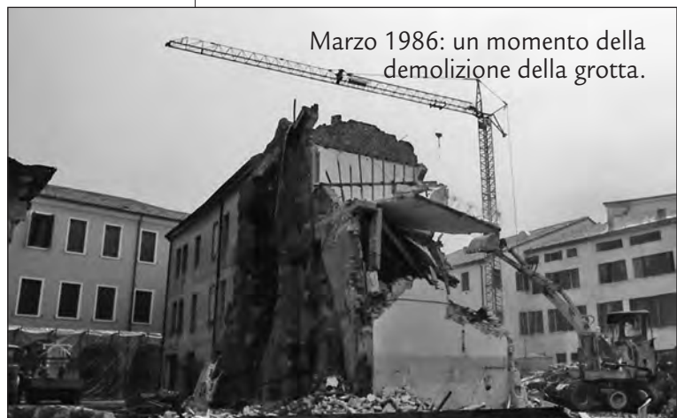
Marzo 1986: un momento della demolizione della grotta.