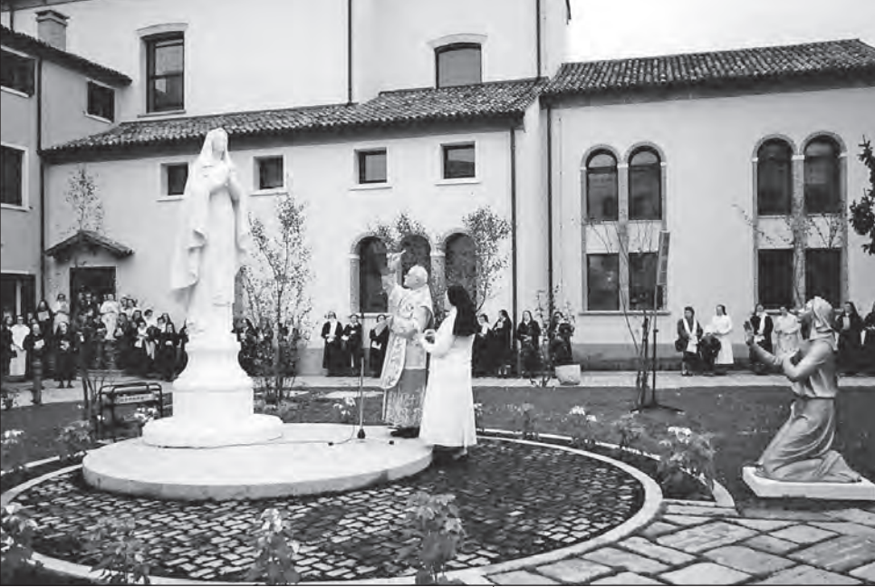
8 dicembre 1987: monsignor Ulderico Gamba benedice l'immagine della Vergine Maria.

che ha seguito i lavori di ristrutturazione di Casa Madre. Leggiamo infatti in un suo articolo nel bollettino «In caritate Christi» del marzo 1986: