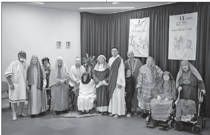
I protagonisti della via crucis del venerdì santo.