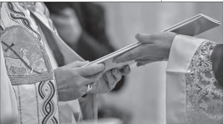
Particolare della consegna della Bolla a un cardinale, 9 maggio 2024.

Per l'apostolo Paolo un segno che caratterizza i cristiani non può non essere che la speranza. Scrivendo agli Efesini (2,12) ricorda loro che, prima di diventare cristiani, erano «senza speranza e senza Dio nel mondo». E ai cristiani di Tessalonica (cf. 1 Tessalonicesi 4,13) parla della speranza oltre la morte, affinché non continuino ad affliggersi «come gli altri che non hanno speranza». Essi non hanno la speranza fondamentale: sono senza speranza perché Gesù Cristo, e solo lui, è la speranza. Senza di lui, senza la sua morte e risurrezione, non si dà vera speranza.