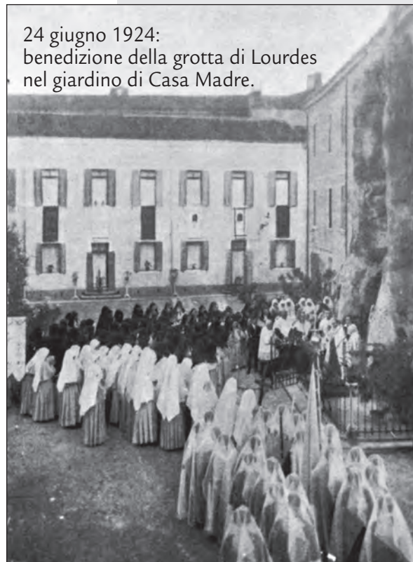
24 giugno 1924: benedizione della grotta di Lourdes nel giardino di Casa Madre.

Prima però fece solenne promessa, riportata nel docu-