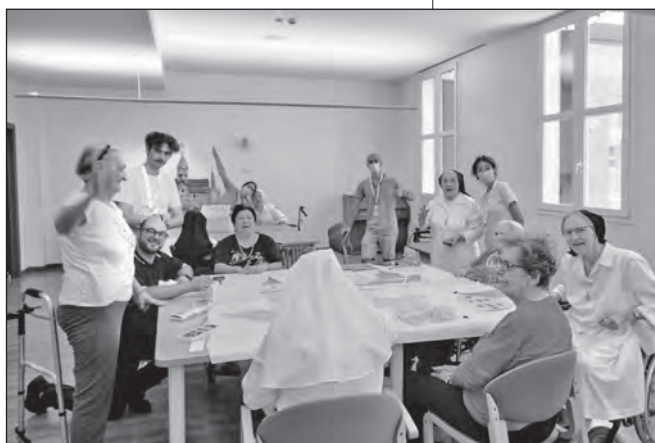
Laboratori con suore e laici di Casa Maran.

Il primo giorno è stato dedicato alla presentazione vicendevole dei partecipanti e alla condivisione del programma della settimana, con la possibilità per ciascuno di scegliere a quale gruppo aderire tra quello dedito alla realizzazione delle scenografie e degli oggetti di scena e quello dedito alla stesura del copione e alla recitazione. Ogni giorno dalle ore 9:30 alle ore 11:30 i giovani, affiancati dalle suore incaricate e dalle educatrici, hanno fatto compagnia agli ospiti indivi-