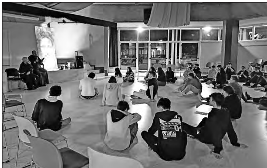
Giovani in preghiera nella veglia del venerdì notte.

Quando mi è stato chiesto di collaborare in una missione, organizzata dai frati cappuccini, dopo Pasqua, in alcuni paesi della diocesi di Padova, ho accettato con gioia e con