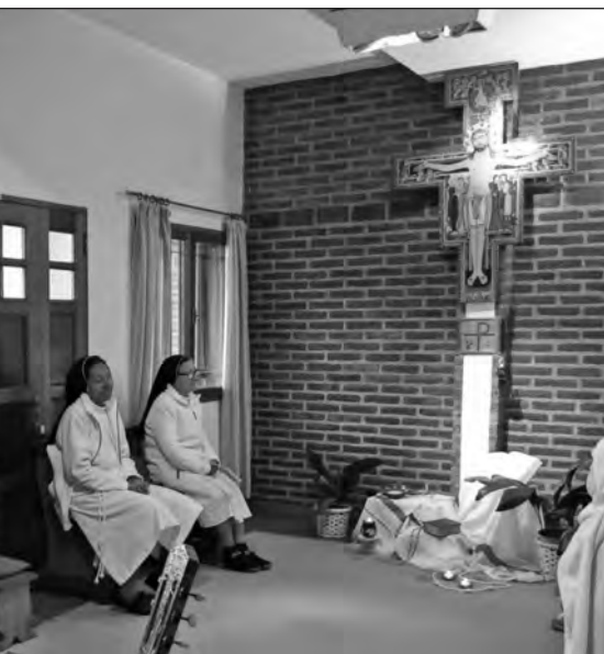
Ai piedi del Maestro.

Sentiamo che è anche il luogo dove continuare a dare spazio alle grandi utopie che ci permettono di continuare a camminare e a sognare insieme, cercando di mantenere