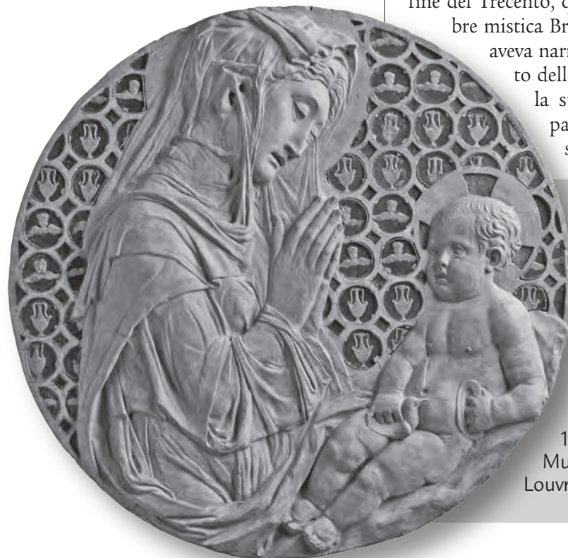
Donatello, Madonna Piot (o tondo della Vergine adorante il Bambino ), terracotta policroma, 1440 circa, Museo del Louvre, Parigi.