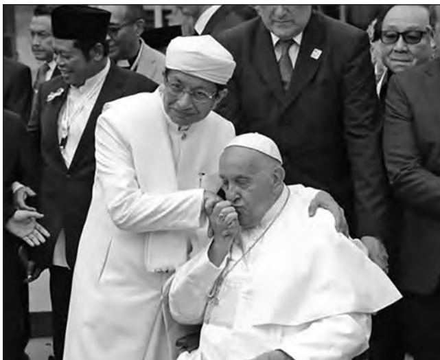
In copertina: papa Francesco bacia la mano al grande iman Nasaruddin Umar, durante il viaggio apostolico nel Sudest asiatico, alla moschea Istiqlat di Giakarta in Indonesia.

Con questo numero si è concluso il servizio di direttore responsabile del dottor Guglielmo Frezza. Lo ringraziamo per questo servizio importante e gli auguriamo ogni bene mentre accogliamo con gratitudine il nuovo direttore responsabile la giornalista Patrizia Parodi.