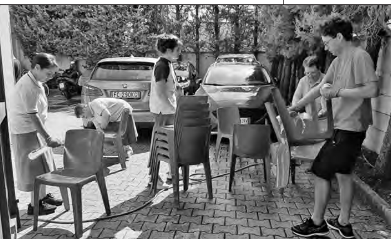
Aiuto nella pulizia di sedie e tavoli.